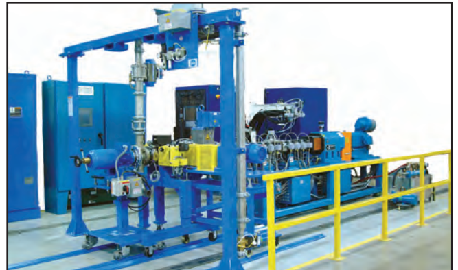
Technikum der Gala Ind. in Eagle Rock, VA, U.S.A.