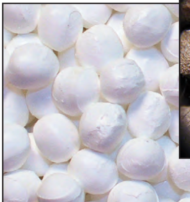
PA-6 mit 5% TiO 2