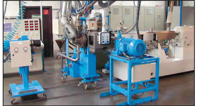
Technikum der Gala GmbH, in Xanten, Deutschland

G ala bietet Granuliersysteme für die Verarbeitung von thermoplastischem Polyurethan (TPU), Polyamiden (PA), Polyester (PET, PBT), Styrolen (ABS, SAN), Polycarbonat (PC), Polyoxymethylen (POM/ Acetal), Fluorpolymeren (PDVF, ECTFE, PTFE, FEP, PFA), Acryl (PMMA), Polysulfonen (PSU, PES), Polyphenylsulfid (PPS), flüssig-kristallines Polymer (LCP), Polyphenylenoxid (PPO), Polyphenylenether (PPE), Phenoxyharze und/oder Kombination dieser Harze mit Hochleistungsfaserverstärkungen.