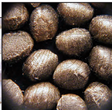
PA-6,6 mit 33% Glasfaseranteil.